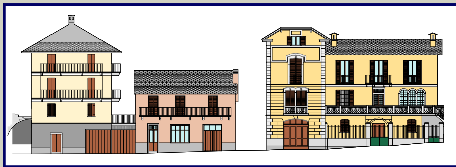
VIA ALBERTO LINCIO