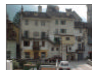
TAVOLA 22 PROGETTO