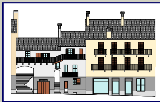
VIA ALBERTO LINCIO